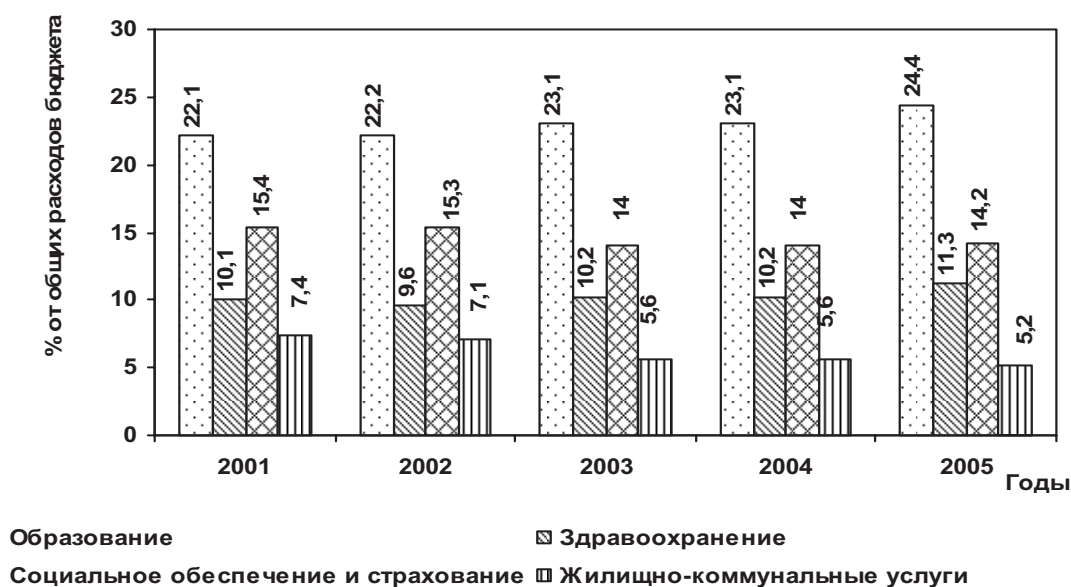
Рисунок 2. Расходы на социальные нужды

Из диаграммы видно, что расходы на социальные нужды растут, однако, в общем объеме бюджетных расходов их величина остается почти постоянной, рисунок 2.