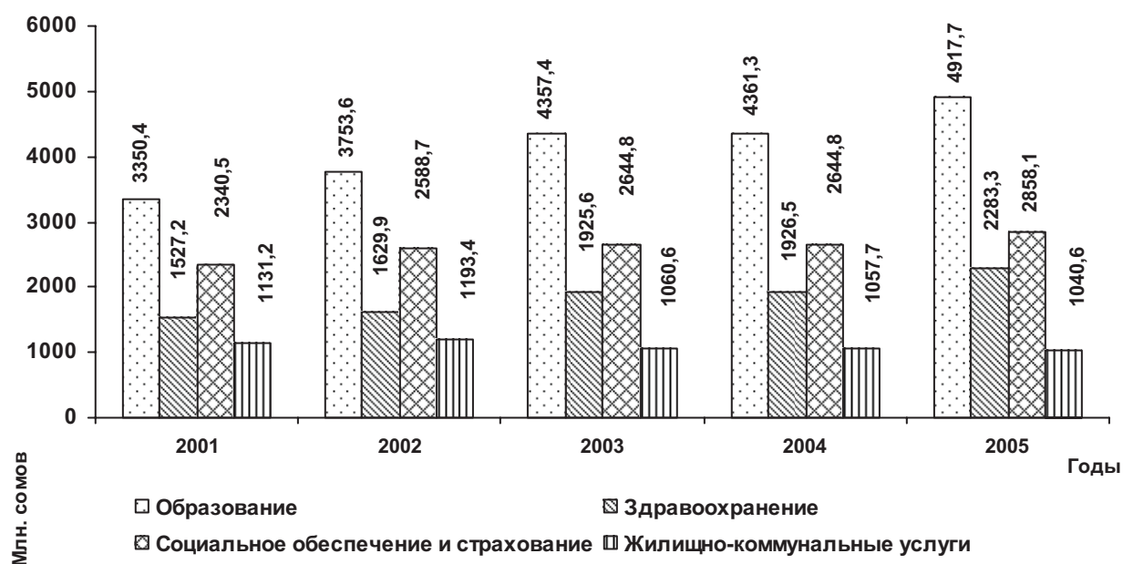
Рисунок 1. Расходы бюджета Кыргызской Республики на социальную сферу

Расходы бюджета Кыргызской Республики на социальную сферу представлены в на рисунке 1.