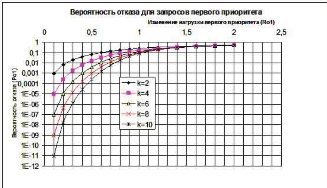
Рисунок 2. Зависимость вероятности отказов в обслуживании для запросов первого приоритета от нагрузок первого приоритета ( p_1 ) для определенных значений нагрузок второго приоритета ( p_2 ).